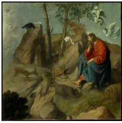
예수님, 광야에서 유혹을 받으시다 (마르 1,12)