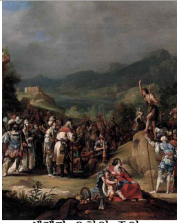
세례자 요한의 증언 Bartholomeus Breenbergh