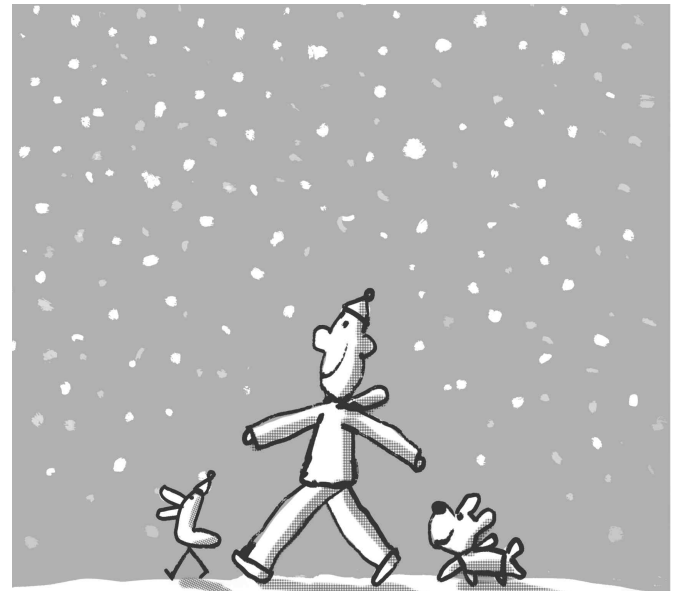
Jan, 2024, Manhattan 눈내린날