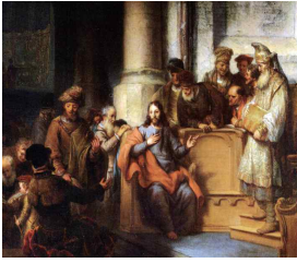
예수님께서 나자렛의 회당에서 가르치심 Gerbrand van den Eeckhout.