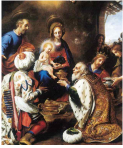
왕들의 경배 Carlo Dolci, 1649.