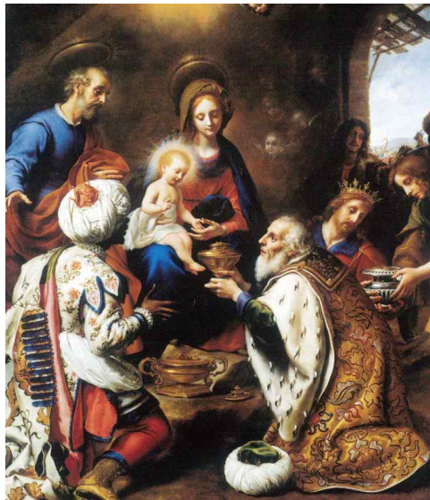
왕들의 경배 Carlo Dolci, 1649.

어둡고 낡은 오두막에 별이 밝게 빛을 내고 예수님을 환하게 비추며 메시아가 오셨음을 알립니다.